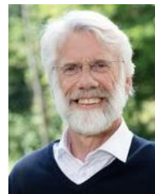
Hoogleraar Erik Scherder