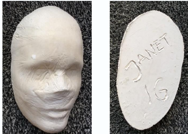
Deep Brain Stimulation (DBS) 16-4-2020