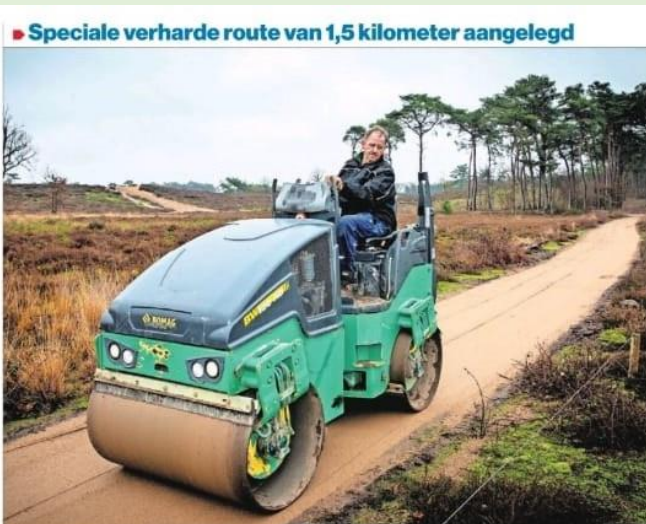
▲ Een machinist wals het materiaal.