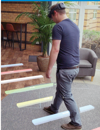
Figuur 1: cues ter ondersteuning van het lopen

Aan de Vrije Universiteit Amsterdam doen wij onderzoek naar een bril om het bewegen bij mensen met de ziekte van Parkinson te verbeteren. Met deze bril kunt u waar en wanneer u maar wilt strategieën, zoals visuele cues, oproepen ter ondersteuning van het lopen (Figuur 1). Ook kunt u thuis spelenderwijs werken aan het verbeteren van uw loop- en balansvaardigheden in aanvulling op fysiotherapie (Figuur 2).